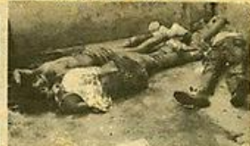
Tres de los tantos muertos del retén de Catia.

Para finalizar, en su comunicado los procesados del Retén Judicial de Catia hacen un llamado a todas las autoridades competentes para que lleven a término una investigación a fondo y consciente de lo sucedido allí los días 27, 28 y 29 de noviembre pasado, establezcan las sanciones a quien hubiera que sancionar. Asimismo, llaman a la Comisión de Derechos Humanos de la Fiscalía General de la República para que rememore los difíciles momentos por lo que atravesaron y no permitan que este hecho quede impune, mismo en el que fallecieron, tal y como lo dice, más de 500 reclusos. Los supervivientes de la masacre del Retén de Los Flores de Catia imploramos ayuda y justicia, queremos que nos adjuquen y ubiquen en el perímetro más cercano y nuestros tribunales... queremos justicia para los culpables y libertad para los inocentes".