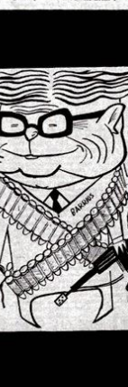
Actores principales en el drama de las torturas a los presos políticos.