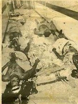
Decenas de cadáveres permanecieron varios días en los muros de distintos hospitales.

Al entrar la tarde del 27 de noviembre, cuentan, continuaba nuestra desesperación porque no sabíamos en qué momento nos tocaría a nosotros correr la misma suerte de decenas de compañeros ajusticiados a manos de la Guardia Nacional y Policía Metropolitana... padres inocentes ajusticiados por la arcaica y adolecida ley de nuestro país. De noche, entre otros muros, escuchábamos el tableteo de metralletas y fusiles automáticos. Los asesinos policia-