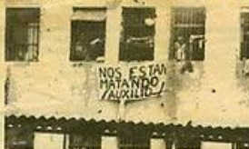
En la gráfica de Fernando Sánchez, tomada durante esos días, se aprecia el clamor de los presos.

los disparaban para confundir a la opinión pública y autoridades gubernamentales, buscando quizás un justificativo por lo que hacían. Después alegaron que nosotros estábamos armados; cantidades de cuerpos sangrantes cayeron en los pisos de las celdas... ellos disparaban desde el patio posterior que da al barrio La Lina. Su acción, seguramente, sólo hubiese sido evitada por el más grande asesino de nuestra historia contemporánea: Adolfo Hiler.