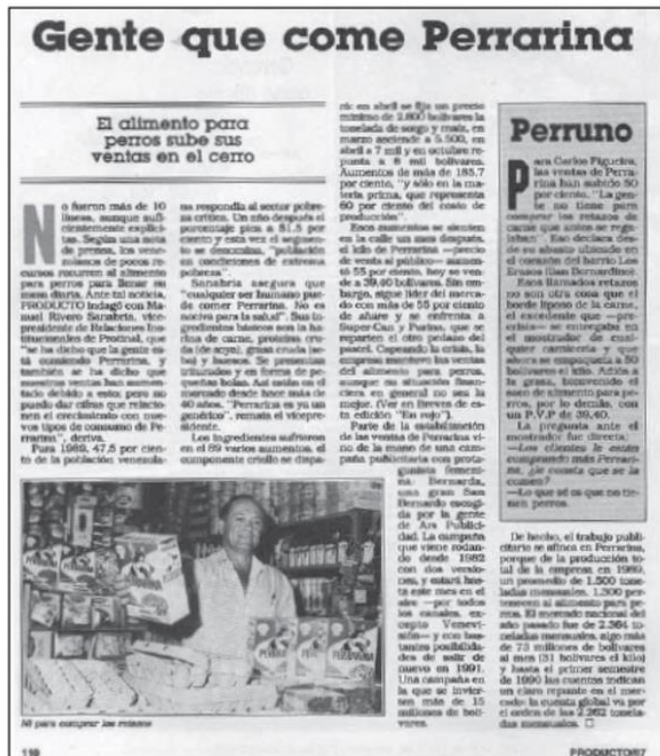
La publicación especializada en publicidad y mercadeo registró el fenómeno.

En algunos momentos, la escasez y la carestía de los precios empujaron a los sectores más olvidados y desfavorecidos de la sociedad venezolana, a subsistir a base de comida para perros "perrarina", único alimento que se podían permitir: